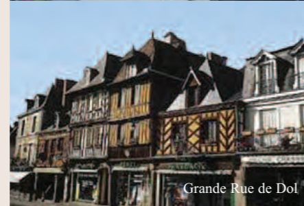
Grande Rue de Dol