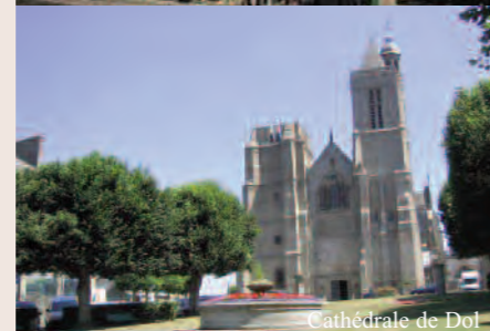
Cathédrale de Dol