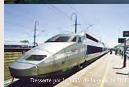
Desserte par le TGV de la gare de Dol