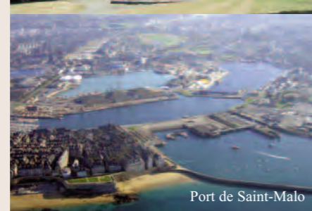
Port de Saint-Malo