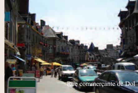
Rue commerçante de Dol