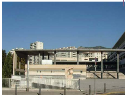
UFR Droit Toulon centre-ville