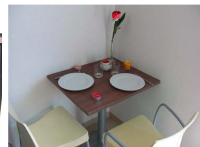
Photos réelles appartement témoin