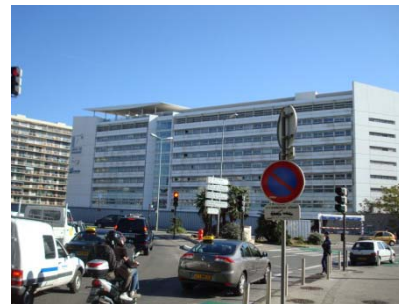
Ecoles d'ingénieur Toulon centre-ville