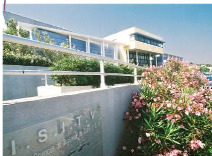
La Garde – La Valette