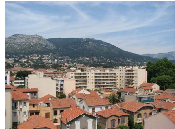
Date des photos : mai 2008